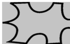
Pełna skóra licowa