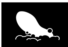
Wyjmowana wkładka z możliwością prania